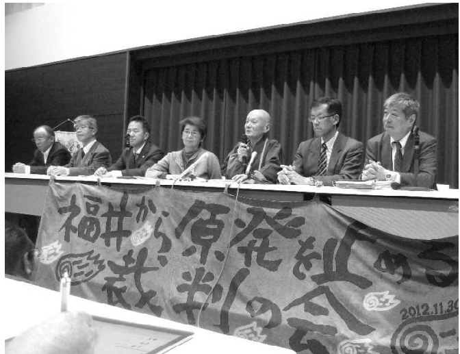
閉廷後の報告集会(11/20金沢弁護士会館)

原告側の弁護団が提出した文書（書証説明）は580点に及び、その主要なプレゼンも毎回の公判で行なった。ちなみに、被告弁護団の文書提出は286点。法廷でのプレゼンは皆無。ただ、内藤裁判長が唯一採用